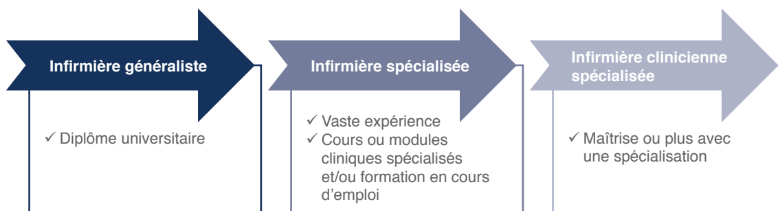
Figure 1 : progression d’infirmière généraliste à infirmière clinicienne spécialisée

La figure 1 décrit la progression d’infirmière généraliste à ICS, en suivant un programme de master propre à l’ICS. Cette progression permet de reconnaître les fondements de l’expertise clinique spécialisée sur la base d’une formation d’infirmière généraliste. Une infirmière généraliste peut directement intégrer un programme d’ICS si elle satisfait les critères nationaux et universitaires de formation à l’ICS. L’obtention d’un master au minimum confère une plus grande crédibilité professionnelle et clinique à l’infirmière, qui progresse ainsi pour obtenir le titre d’ICS. La formation supplémentaire et l’expertise clinique acquises grâce à un diplôme